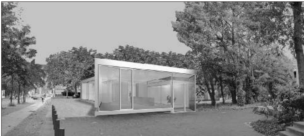
Die architektonische Vision der neuen Ausstellungshalle