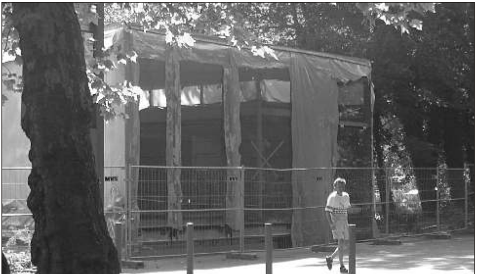
Der Rohbau wartet auf den Ausbau des Innenraumes

wurde im November 2003 begonnen und sollte im September 2004 fertiggestellt sein. Mit dem Richtfest wurde eine weitere Etappe in Bezug auf den zweiten Bauabschnitt der „Galerie für zeitgenössische Kunst“ genommen. Ein Neubau war von Anfang an geplant, seine Realisierung blieb aber bis Ende 2001 ungeklärt. Erst durch eine einzigartige gemeinsame Initiative des Freistaates Sachsen, der