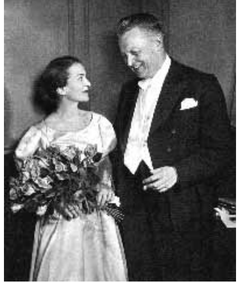
Hermann Abendroth mit der ungarischen Pianistin Annie Fischer

Am 29. Mai 1956 starb er nach kurzer Krankheit 73-jährig in Jena. Mit einem Staatsbegrabnis wurde er in Weimar beigesetzt. In einem persönlichen Nachruf schrieb damals David Oistrach: „Es fällt schwer, die Gefühle zum Ausdruck zu bringen, die mich bewegen,