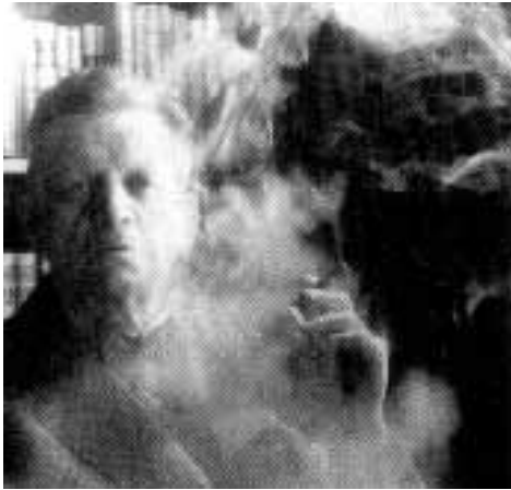
Abendroth mit seiner stets dampfende Zigarre

„Ohne Volldampf geht es nicht recht vorwärts“. Diese Äußerung Hermann Abendroths ist in doppelter Hinsicht zu verstehen: Zum einen kennzeichnet sie das rastlose Engagement im Dienst der Musik, der Interpretation, zum anderen verweist sie auf ein unverzichtbares Attribut des Dirigenten – die stets dampfende Zigarre, selbst in den Proben! Als ihn einmal ein Musiker des Leipziger Rundfunk-Sinfonieorchesters bei einer Aufnahme im Sendesaal auf das strikte Rauchverbot hinwies, zückte er gelassen ein Schreiben aus der Westentasche, das es ihm als einzigem erlaubte, im Funkhaus zu rauchen. Diese Zusicherung soll sogar Gegenstand der Antrittsverhandlungen gewesen sein. Heute undenkbar!